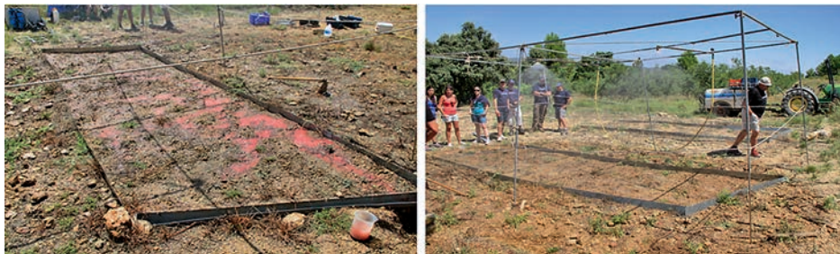
Figura 1. Vista de dos experimentos con la parcela de 12 m 2 y el simulador de lluvia sin cubierta protectora del viento.

zonas seleccionadas se estudiaron 4 parcelas de 300 m, lo que totaliza 6 Km de mediciones (5 zonas x 4 parcelas x 300 m por parcela). Las mediciones se realizaron en agosto de 2008 con los suelos de cultivo tradicional de secano recién labrados y los suelos de explotaciones de cítricos tratados con herbicidas y con muy escasa cubierta vegetal. Tanto el laboreo en el olivar en secano, como herbicidas en el regadío de cítricos sirven para eliminar la competencia de las malas hierbas. En octubre de 2007 se produjo una precipitación intensa (180 mm día -1 ) y que dejó en los campos de cítricos morfologías erosivas como regueros, cárcavas y barrancos. En aquellos que hubo laboreos los regueros, cárcavas y barrancos fueron eliminados por el paso del arado. En los campos de cítricos y en los campos abandonados menos de 5 años permanecieron hasta el momento del muestreo.